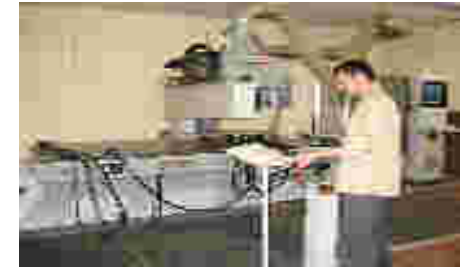
CNCko erreminten konfigurazioa

Compass ( CNC disenua eta mekanizatua eskailerak )