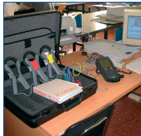
Analizador de redes, parte del equipamiento requerido para la impartición del curso.

Reseñamos con satisfacción que hasta la fecha, todos los cursillistas que se han presentado a las pruebas selectivas para la obtención del carné las han superado.