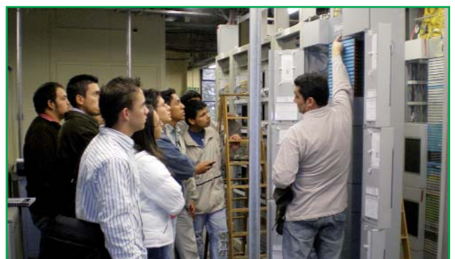
Visita a una Central Telefónica