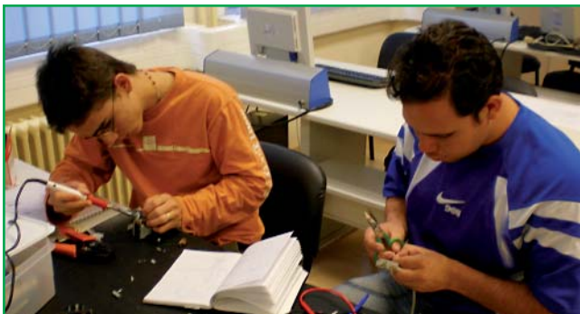
Prácticas de Telemática