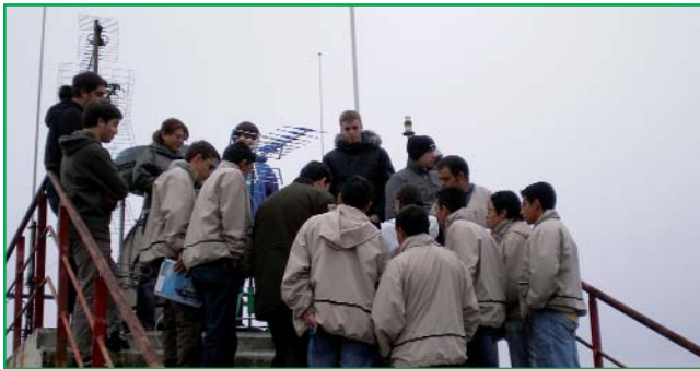
Toma de datos en la Instalación de antenas en la terraza del Instituto.