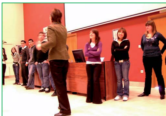
Grupo de asistentes al curso "Cómo hablar en público" durante la realización de un ejercicio práctico.