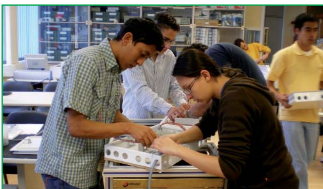
Prácticas de Telefonía