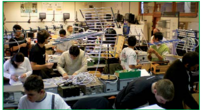
Prácticas de montaje en el taller de Radio Televisión