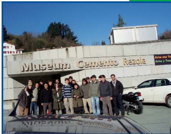
Grupo de alumnos/as y profesores de “Topografía” a las puertas del Museo

Finalmente tuvo lugar un turno de preguntas sobre las fases de producción del cemento Pórtland y de cementos especiales que resultó de mucho interés.