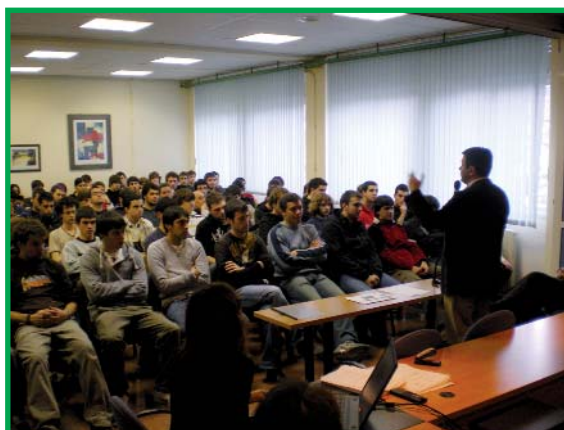
Jose Antonio Santano, alcalde de Irún en el Salón de Actos del centro durante su encuentro con los alumnos y alumnas del Instituto Bidasoa.

Los alumnos hicieron diversas propuestas para incluir en el Plan Estratégico "Irún 2020" y continuarán profundizando sobre las mismas en el módulo de Formación y Orientación Laboral.