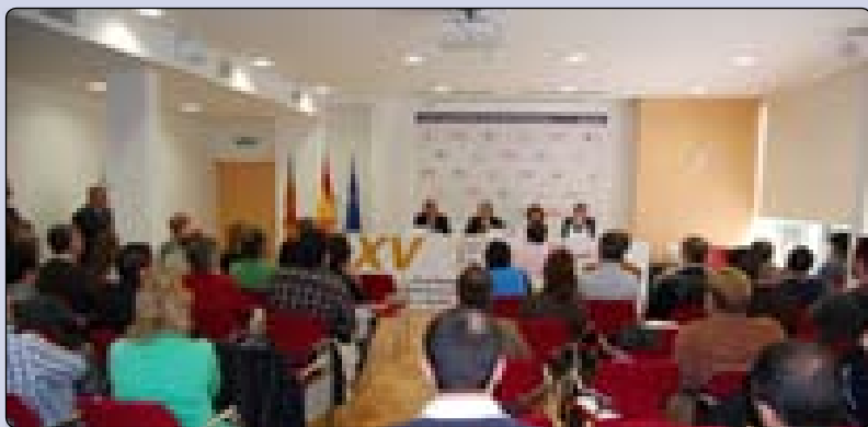
Momento de la entrega de premios del VI concurso nacional de madera y mueble.

Durante los días 16, 17 y 18 de abril tuvo lugar en Valencia, la VI edición del concurso anual "Proyectos de Instalación y Desarrollo de Productos de Madera y Mueble" que organiza el IEFPS BIDASOA de Irún con el patrocinio de Confemadera, AMPA Bidasoa, Ayuntamiento de Irún, Servef (Servici Valenciá d'ocupació i formació) y Asociación del profesorado de Madera y Mueble.