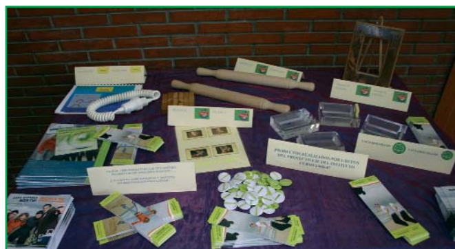
Muestra de algunos de los productos fabricados por los alumnos participantes en el Programa Valnalón.

E l proyecto EJE plantea a los alumnos/as el reto de crear y gestionar una empresa en un contexto práctico y real. Pretende, además, que estas empresas creadas por ellos/as desarrollen su actividad y establezcan relaciones comerciales con empresas similares creadas en otros centros con las que intercambiar catálogo de productos, negociar pedidos y también, que comercialicen dichos productos en el mercado local.