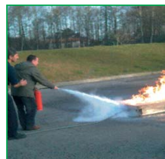
Práctica de extinción de incendios en el Parque de Bomberos de Irún.