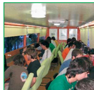
Curso básico PRL para alumnado (OSALAN).