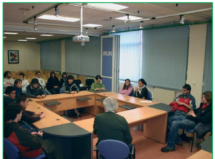
Alumnos y alumnas del Instituto Plaiaundi en un momento de la presentación