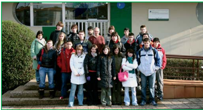
Grupo de alumnos y alumnas de Hiru-Bide

Gazte hauenganako daukagun erantzukizunaz jabeturik, ikastaro honek, betiko ate irekien jardunaldiaz gain, bailarako zentroei zuzendutako sesio espezifikoak antolatu ditugu, beraintzat oso garrantzitsuak diren informazioa eman ahal izateko, erabakiak hartzeko hain garrantzitsuak diren une hauetan.