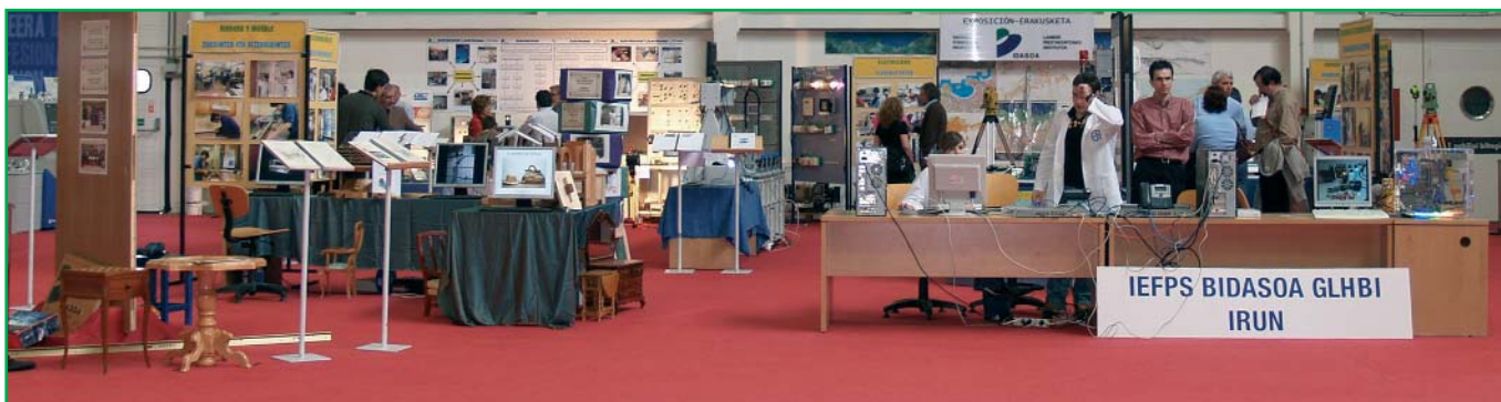
Aspecto general del stand del Instituto Bidasoa en la Feria Aukera celebrada en el recinto de Ficoba los días 26, 27 y 28 de abril de 2007 que acogió a más de 4000 estudiantes.