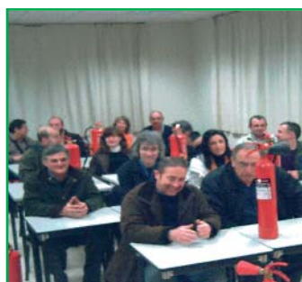
Curso de extinción de incendios en el Instituto.