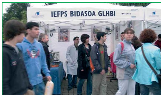
Stand del Instituto en el Salón Educación “Kutxa Espacio” que tuvo lugar en Miramón (Donosti) los días 4 y 5 de mayo.